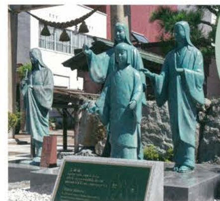
北の庄城址公園 (柴田神社) ↑写真「柴田勝家」像 ←写真「お市」と「三姉妹」像

戦国ロマンを秘めた勇猛な武将柴田勝家と、戦国一の美女お市が織り成す北の庄城悲哀の物語。今も時代を超えて二人の生き方に魅了される方も多いことでしょう。